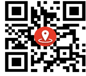
مرکز بهداشت شهرستان