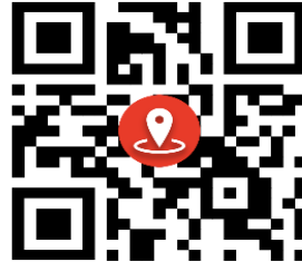
پایگاه سلامت صمیمی