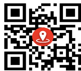
پایگاه سلامت صاحب الزمان عج