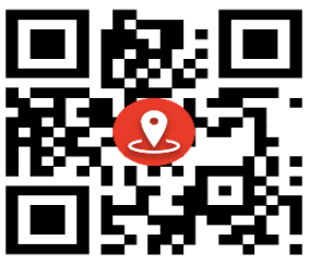
مرکز جامع سلامت سلطان امیر احمد