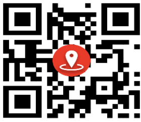
پایگاه سلامت چشمه ای