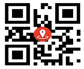
مرکز جامع سلامت مادر